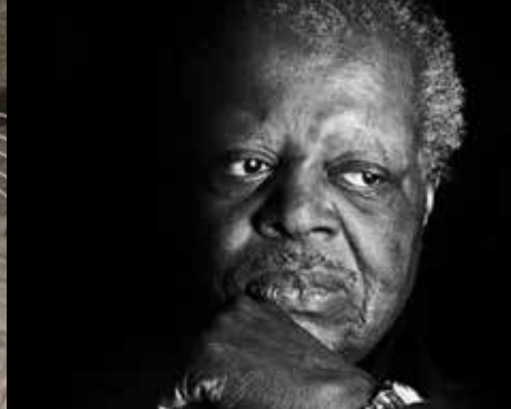
Images du film/ Images from film; Photo: Canadian Broadcasting Corporation